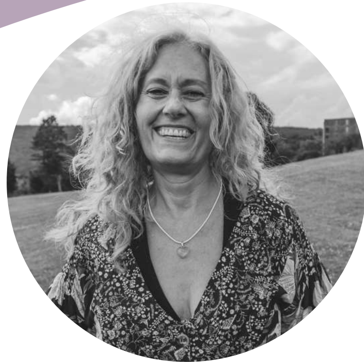
Debra Pascali-Bonaro Doula y cineasta E E . U U