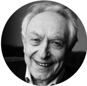
Michel Odent Obstetra Francia