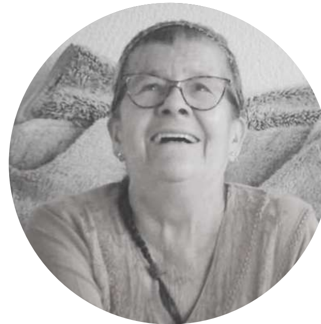
Abuela Naco Partera tradicional COLOMBIA