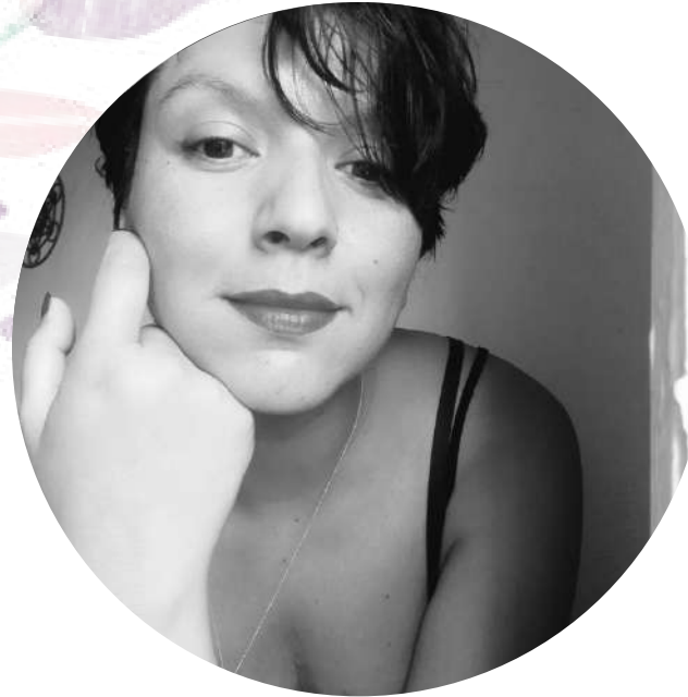
Estefania Flores Actriz