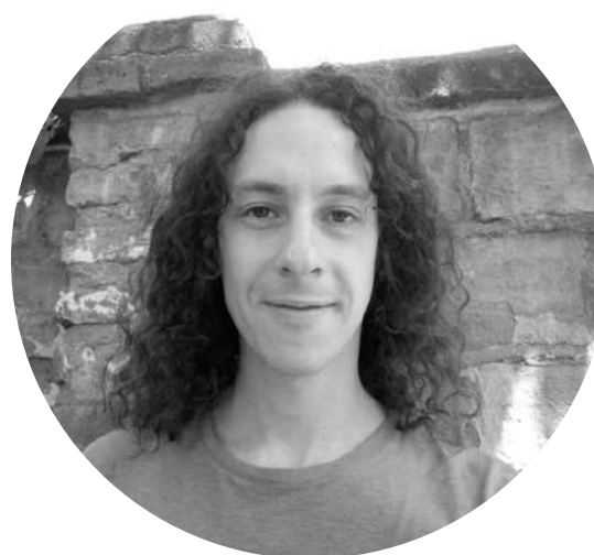
Lautaro Poblete ACTOR CHILE